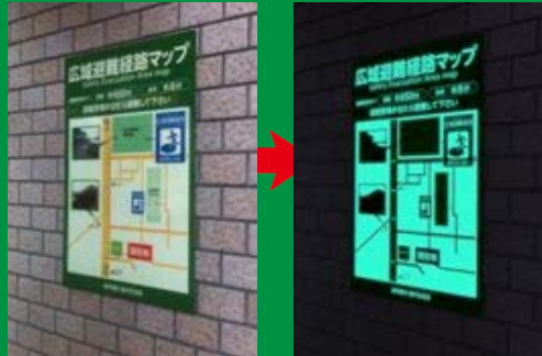
壁面タイプイメージ